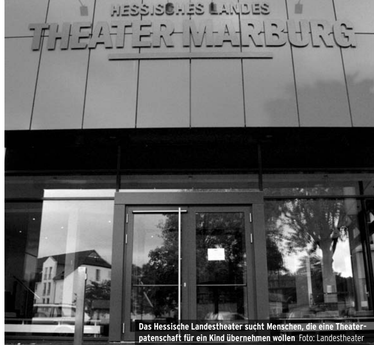
Das Hessische Landestheater sucht Menschen, die eine Theaterpatenschaft für ein Kind übernehmen wollen

http://www.med.uni-marburg.de/d-einrichtungen/transfusionsmed/