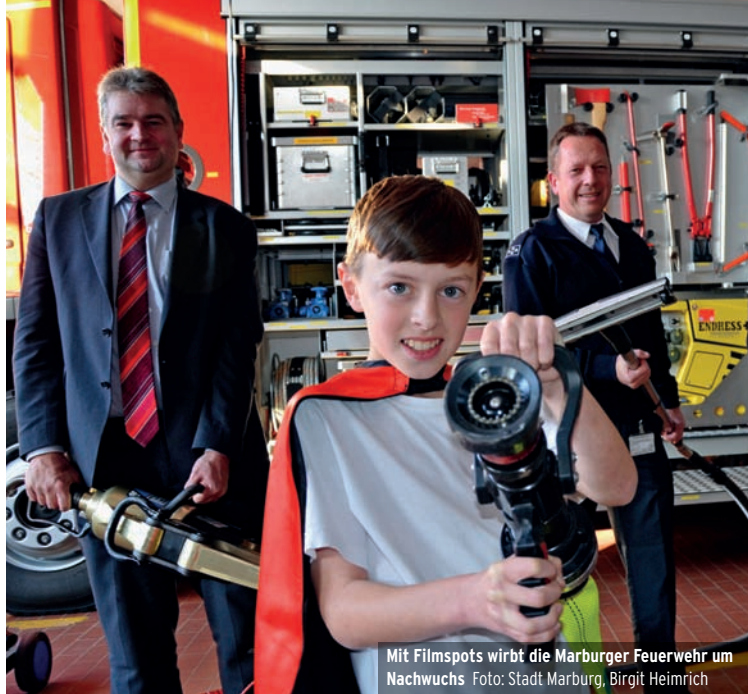
Mit Filmspots wirbt die Marburger Feuerwehr um Nachwuchs

Dann findet der Internationale Tag „Cities of Life“ statt. Es ist die weltweit größte Mobilisierung von Städten und Bürgern für Menschlichkeit und Achtung der Menschenrechte.